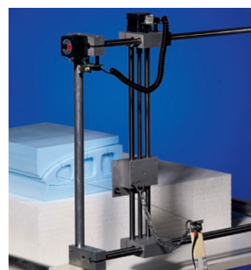
Portaleinheit der PC-CUT Standard