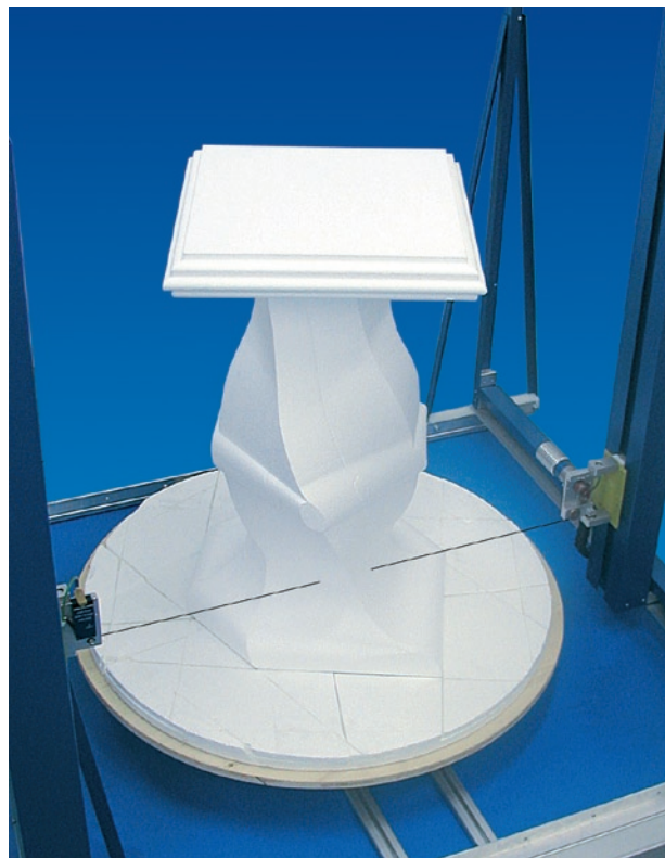
Drehteller auf PC-CUT 1000