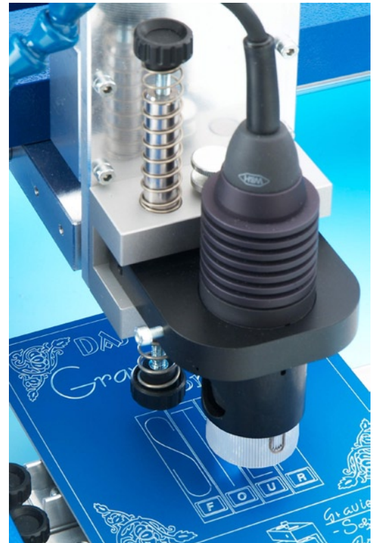
Schnellfrequenzspindel 160W im Gravuraufsatz